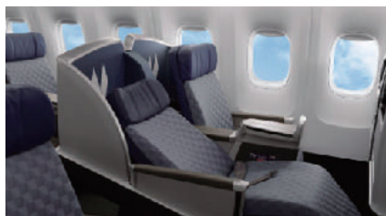
シートピッチ：155cm シート幅：53cm リクライニング：ライフフラット リクライニング時の長さ：193cm