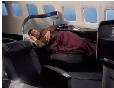
シートピッチ：228cm シート幅：53cm リクライニング：フルフラット リクライニング時の長さ：203cm